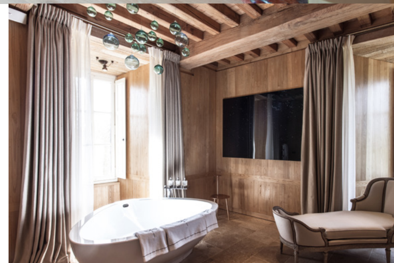
De / From 38 m 2 à / to 41 m 2