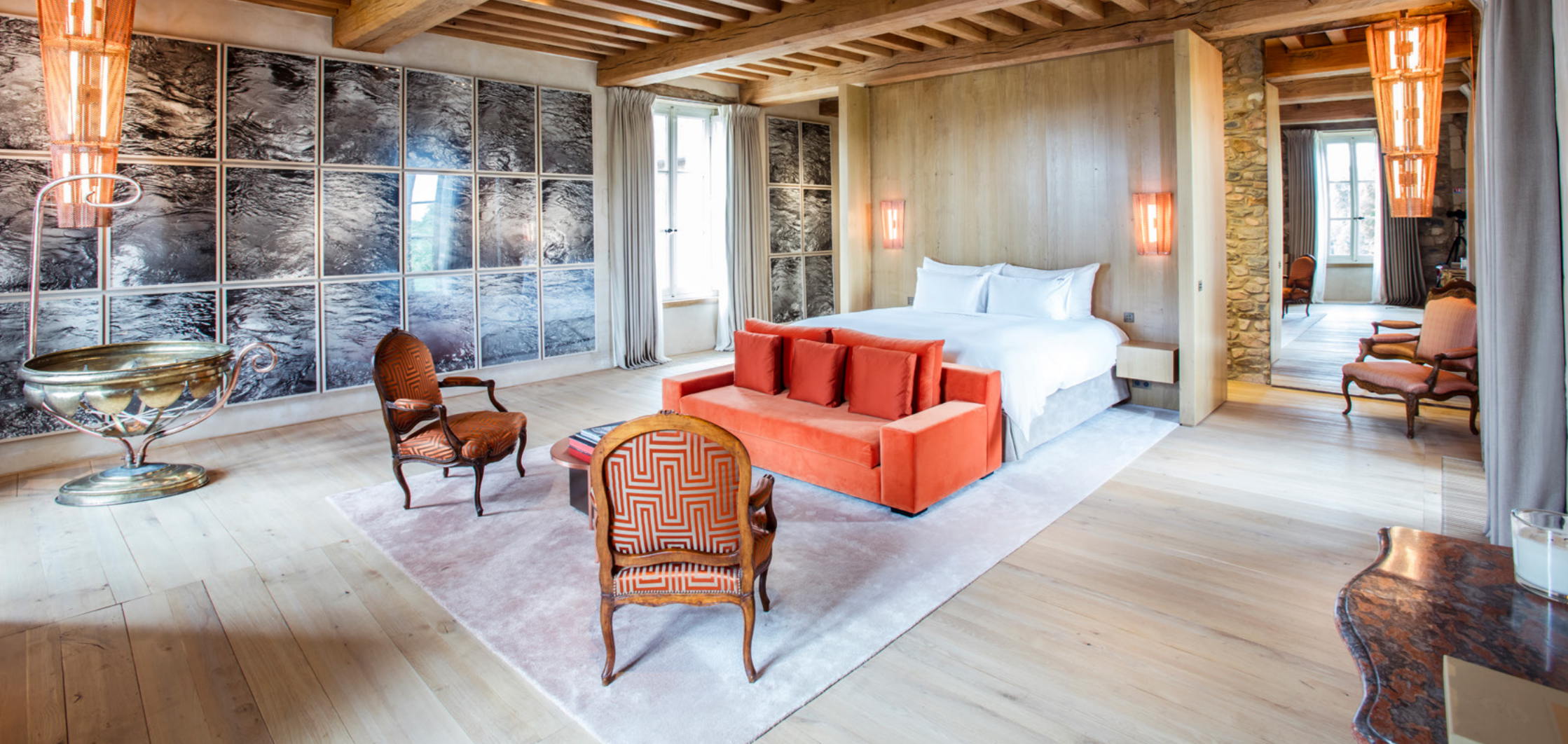
Suite Signature VÉNUMS Signature Suite - VÉNUMS (Venus) 147 m 2