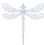
Junior Suite Saison AUTOMNE Junior Suite Season - AUTOMNE (Autumn) 85 m 2