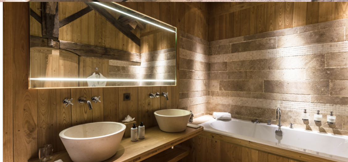
Junior Suite Saison HIVER Junior Suite Season - HIVER (Winter) 75 m 2