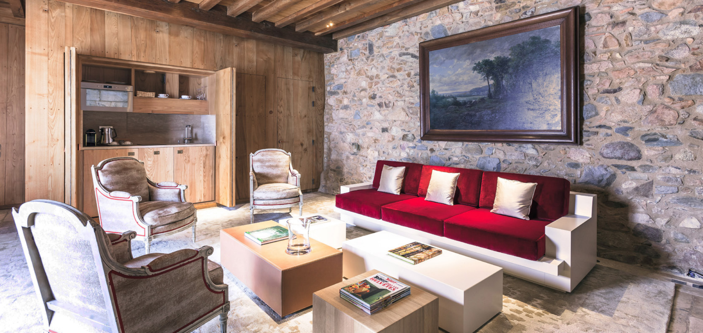
Junior Suite Saison PRINTEMPS Junior Suite Season - PRINTEMPS (Spring) 63 m 2